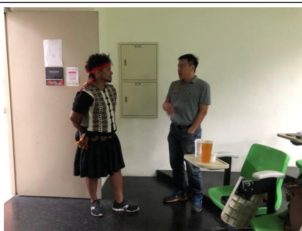
講師與原資中心主任