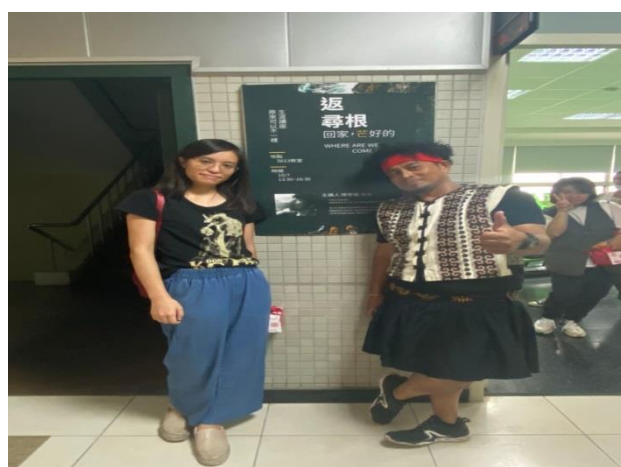
講師與製作海報的同學合照