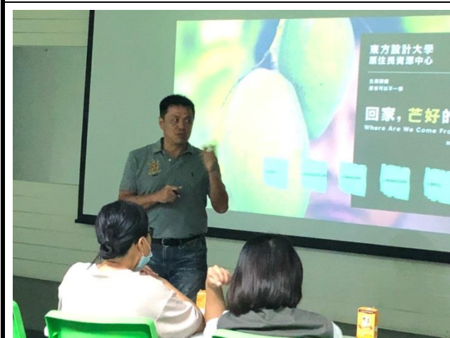
原資中心主任分享