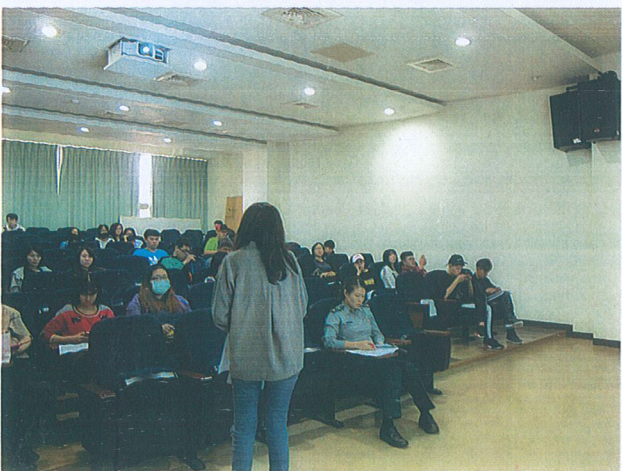
發問問題及回答問題