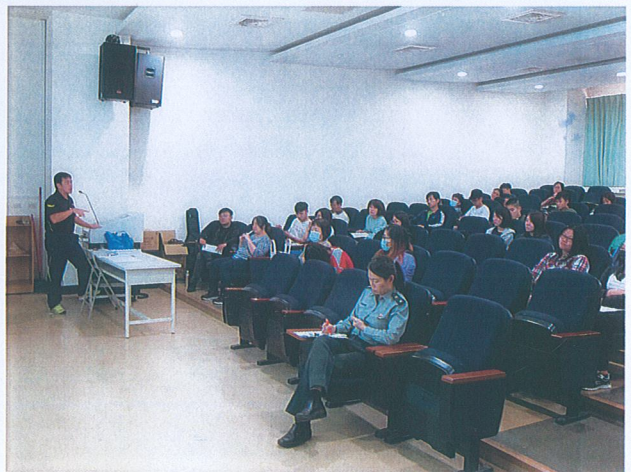
組長說明請購內容