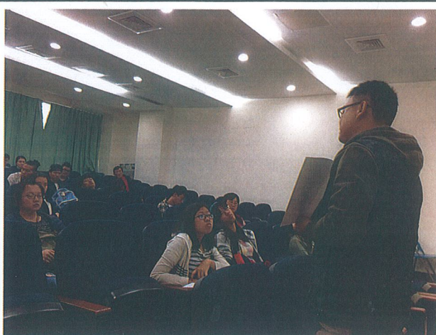
說明社團紀錄冊使用方法