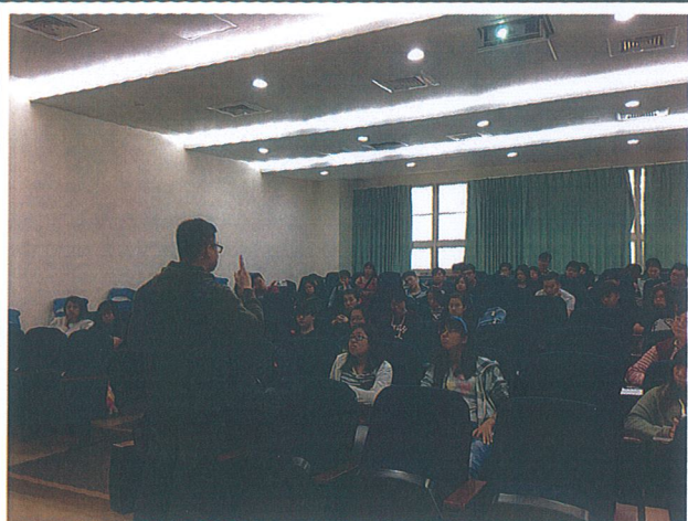
課指組組長講解會議內容