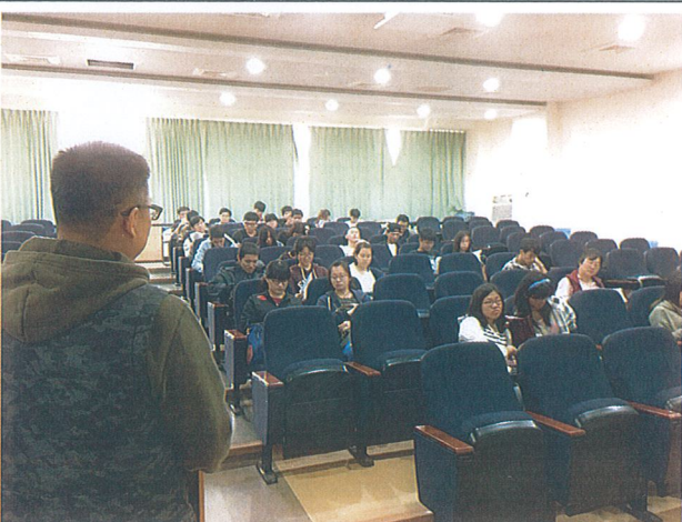
等待提問·會議結束