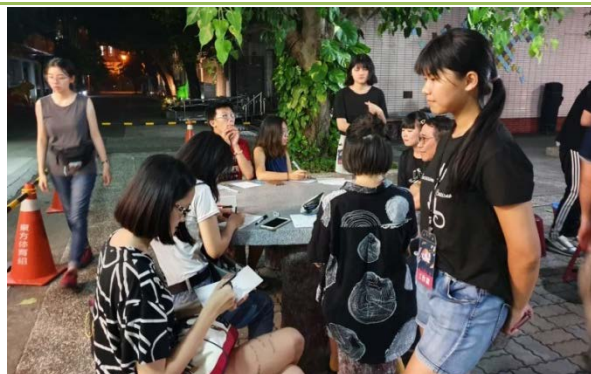
蓄勢待發準備大展身手!!!