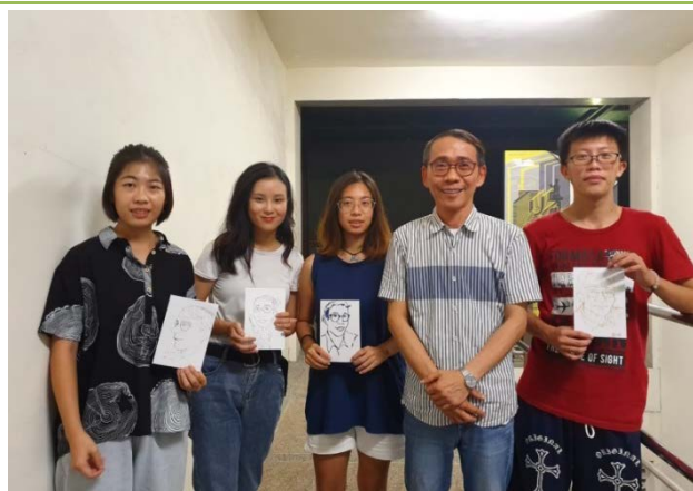
跟老師來張大合照