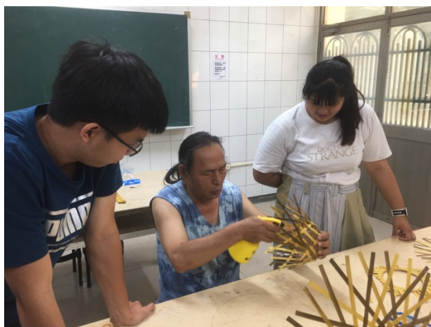
主體的編法教學-縮口